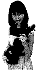
大塚 杏奈 (ヴァイオリン)

2008年夏より一年間ベルリンに留学、マーク・ゴトーニ氏の下で研鑽を積む。2009年から2012年まで洗足学園ニューフィルハーモニック管弦楽団演奏要員。2010年BS-TBS「気ままにクラシック～音旅～」に出演。2013年から2019年まで東京ニューシティー管弦楽団団員。現在は、室内楽を中心に東京を拠点に演奏活動をしている。